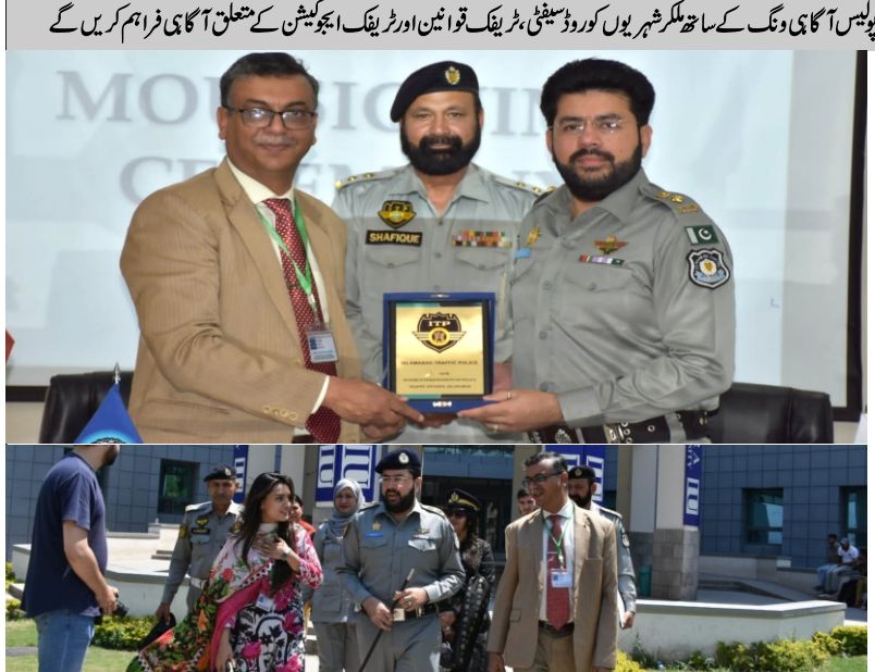
انٹرنشپ کا مقصد کمیونٹی پولیسنگ کو فروغ دینا، نوجوانوں پولیس کے درمیان خلاء کو پر کرناہے تا کہ ایک دوسرے کی صلاحیتوں میں نکھار پیدا کرنا اور بڑھانا اور عوام اور کے لئے اپنائیت کا حساس پیدا ہو۔

ملک کی ترقی میں طلباء اہم کردار ادا کرتے ہیں، اس